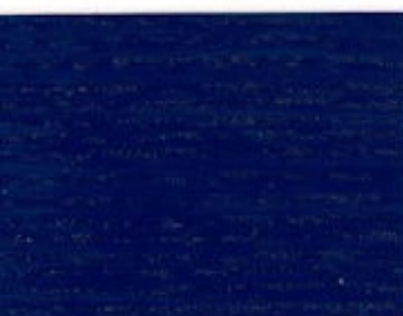
52.26T - Spiruline bleue