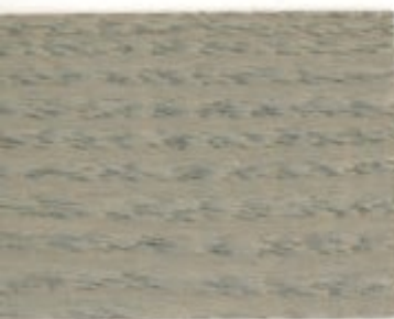
12.62T - Peuplier grisé