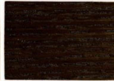
F2.15.25T - Olivier foncé