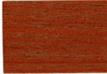
D6.62.40T - Orange Bubinga