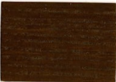
E1.30.28T - Eucalyptus