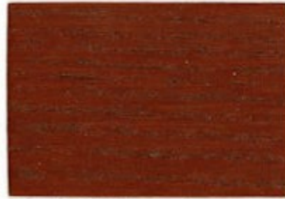
C4.40.20T - Rouge Amarante