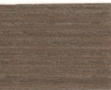
07.45T - Frêne