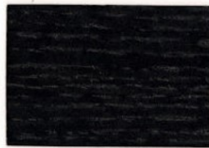
TN.01.11T - Noir Macassar