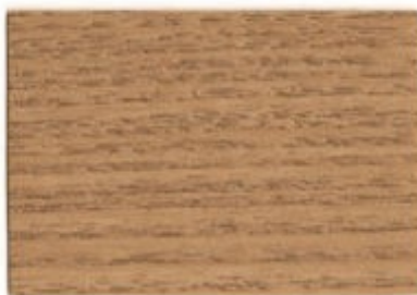
E2.26.56T - Douglas