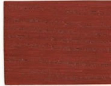
B6.31.36T - Bois royal