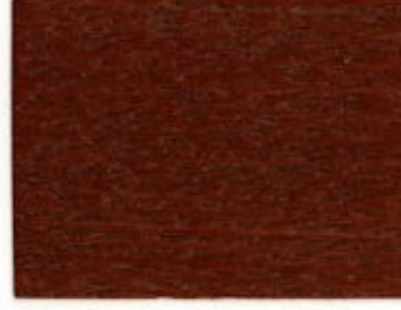
B8.35.25T - Rouge Merbau