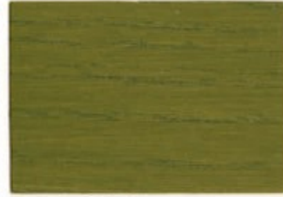
G6.35.40T - Olive