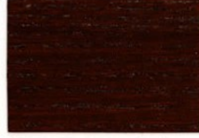
C2.15.15T - Merbau foncé