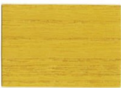
G0.60.75T - Jaune Framiré