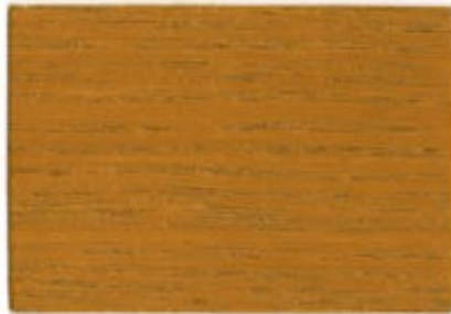
F1.56.57T - Reseda Luteola