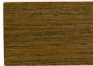
F4.25.30T - Olivier tropical