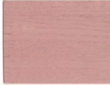
B5.17.64T - Rose Alisier