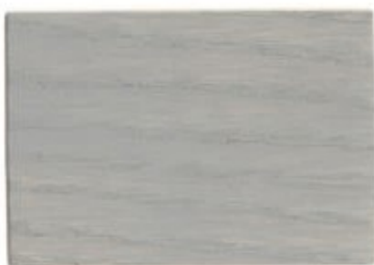
G9.05.67T - Hêtre blanc