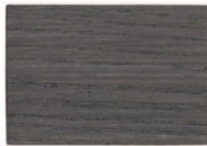
E9.04.37T - Frêne cendré