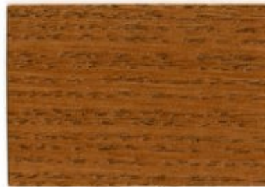
E5.58.44T - Chêne clair