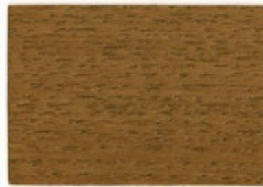
E8.41.51T - Aubier