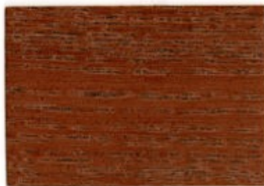
D5.51.29T - Teck