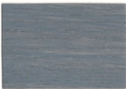
N7.04.52T - Bois grisé