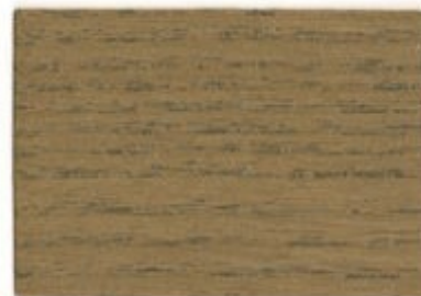
F3.18.55T - Merisier