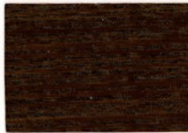
C9.12.09T - Dalmata foncé