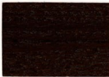
C6.16.11T - Noyer