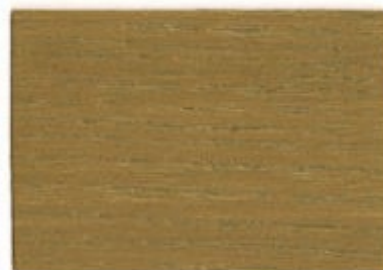
F4.30.50T - Chataigner