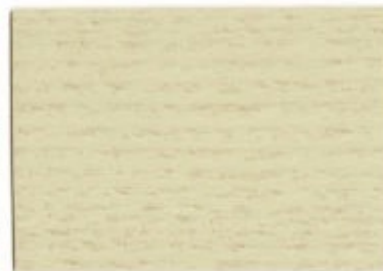
G1.18.82T - Peuplier