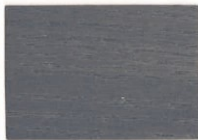
ON.00.40T - Gombé gris