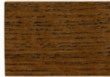
E1.35.22T - Palissandre