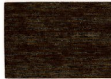
E3.18.21T - Wengé