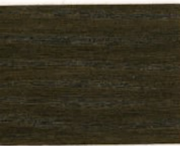
04.15T - Chêne fumé