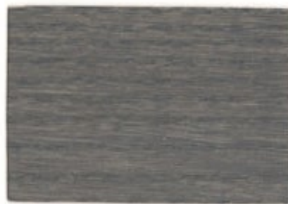
ON.00.60T - Cèdre gris