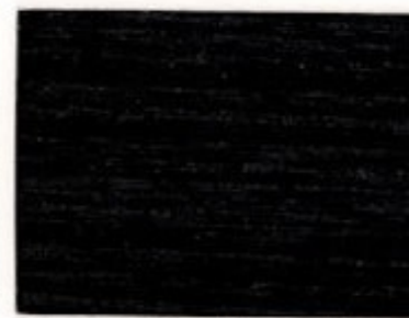
WN.00.06T - Ébène