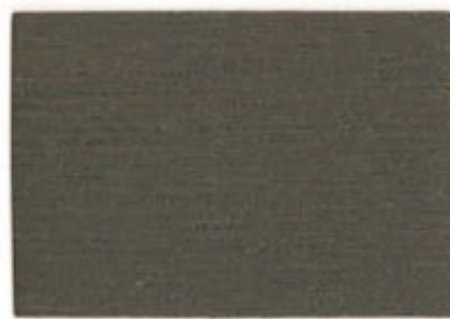
G2.06.34T - Aniegre fumé