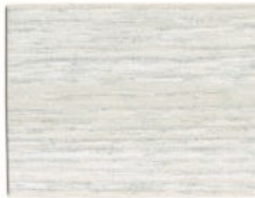
L1.03.77T - Bouleau argenté