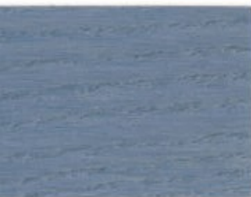
07.57T - Bleu Lavande