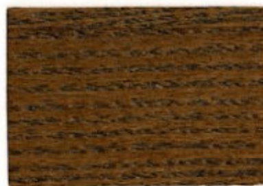
E2.47.34T - Brun palmier