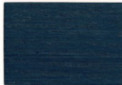
T0.45.20T - Bleu Génipa