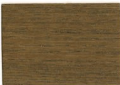
E4.16.46T - Acacia