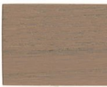
D2.10.50T - Rose Bété