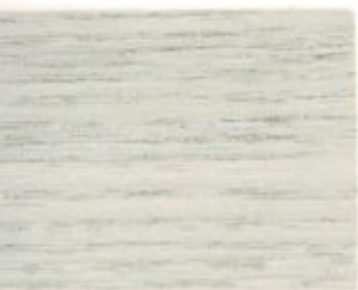
00.81T - Bouleau