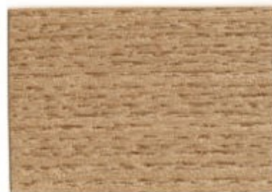
F1.15.72T - Hêtre