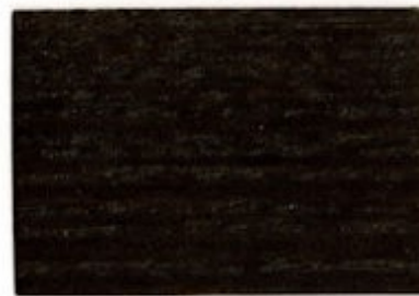
C5.06.08T - Acacia fumé