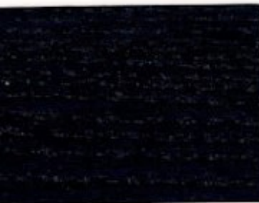
29.14T - Indigo tropical