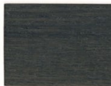
Q7.03.30T - Accoya cendré