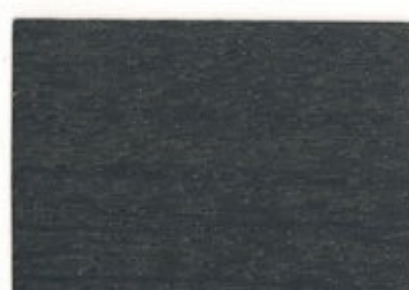
R5.05.29T - Gris Dalbergia