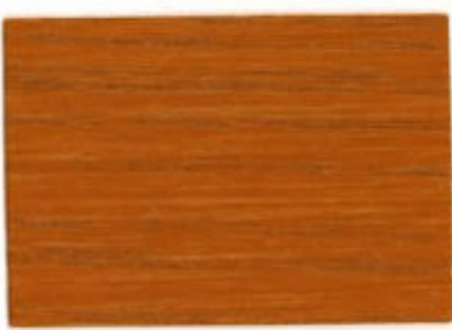
E6.65.60T - Bois de Campêche