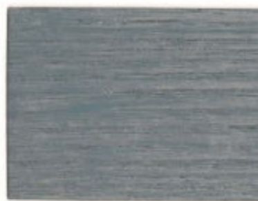
R0.10.60T - Accoya bleuté