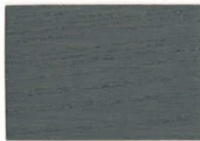
M5.05.39T - Pistachier foncé