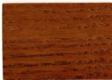
D9.54.32T - Chêne foncé