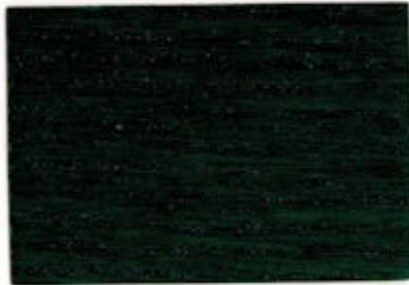
L8.45.04T - Vert Chlorophyle