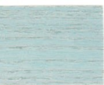
05.75T - Bleu sulfate