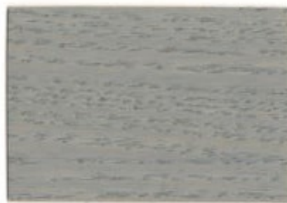
J0.04.59T - Bois givré