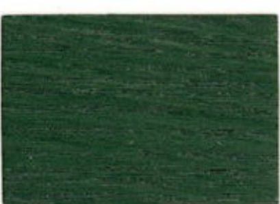
J7.27.36T - Spiruline verte