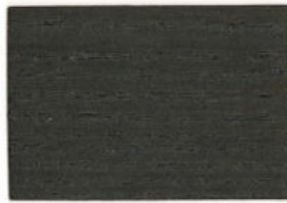
TN.01.27T - Chêne cendré