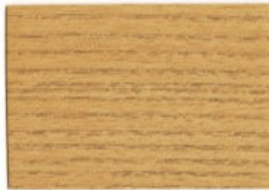
E8.35.66T - Érable naturel