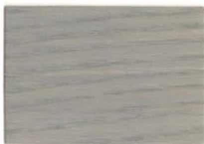
F3.10.61T - Sycomore