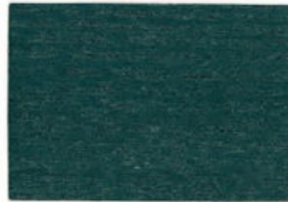
P2.35.35T - Vert Atlas